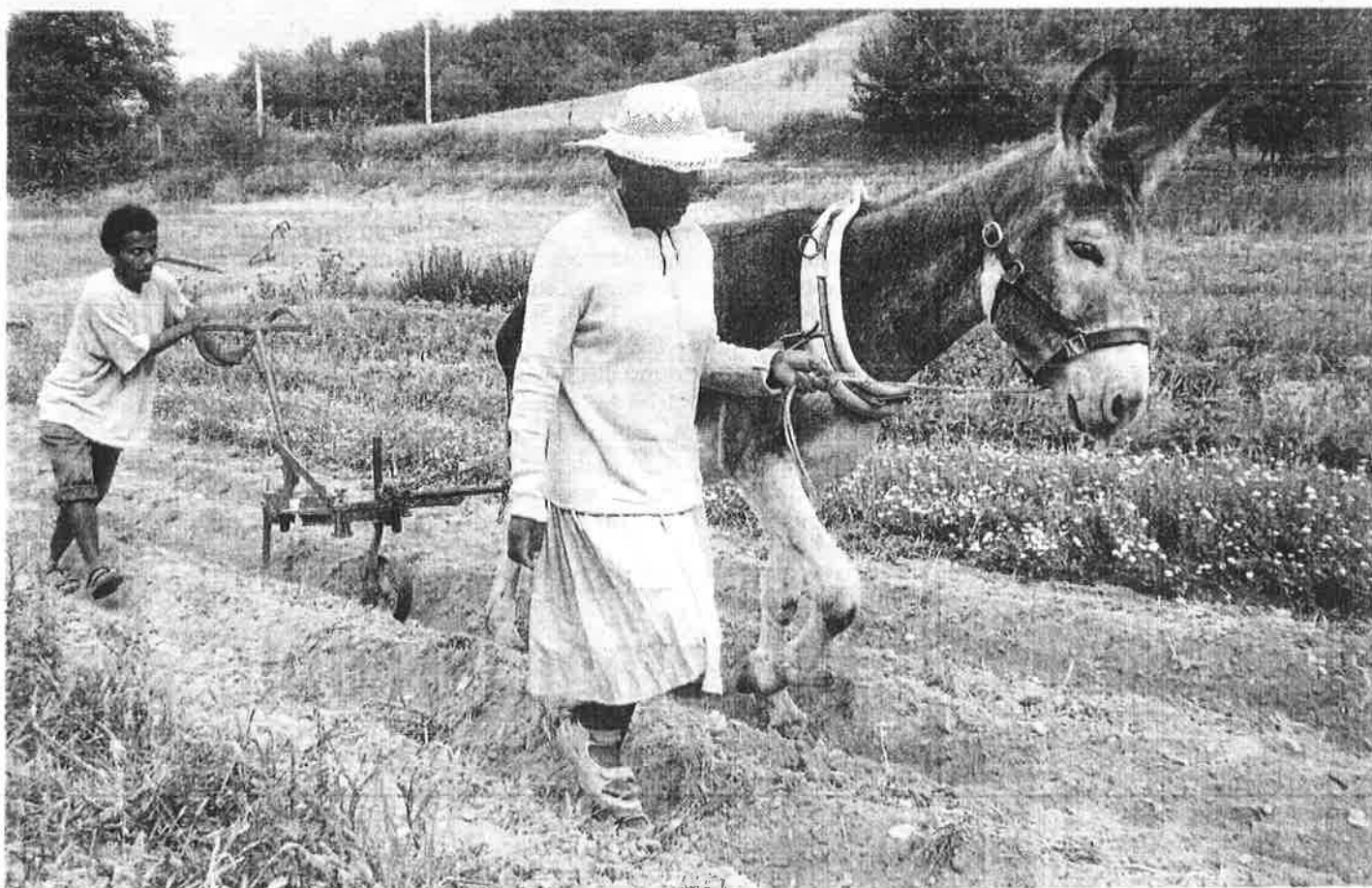
La kassine de Prommata, tractée par un âne, ici, dans un champ de Madagascar.

une région du Niger. Comme pour Madagascar, en août dernier, un formateur viendra sur place pour permettre aux agriculteurs locaux d'acquérir la technique. Page 34